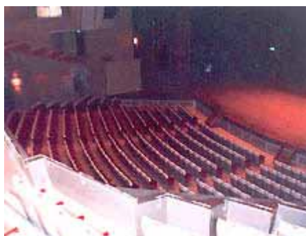
諫早文化会館 大ホール