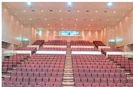
いいもりコミュニティ会館コミュニティホール