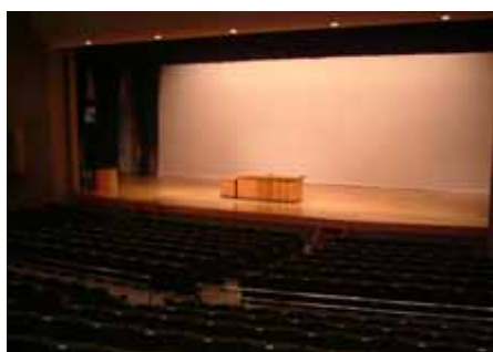
大ホール(ステージ)