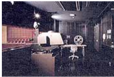
ゆめホール映写室