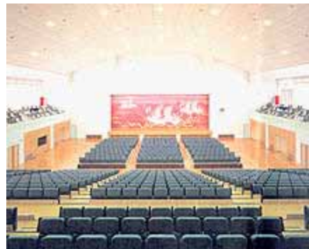
松浦市文化会館 ふれあいホール