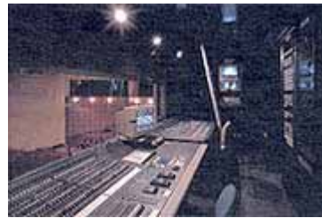
ゆめホール調整室