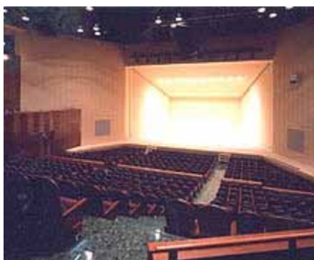
松浦市文化会館 ゆめホール