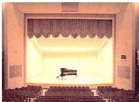
西海市大島文化ホール