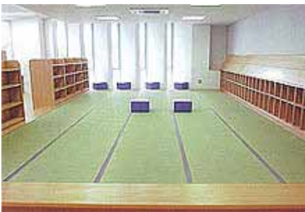
絵本・児童書コーナー