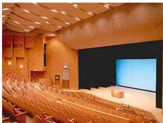
長与町民文化ホール

文化の香りが漂う空間。 爽やかに交わされる会話。 人と人とのコミュニケーションを大切にします。