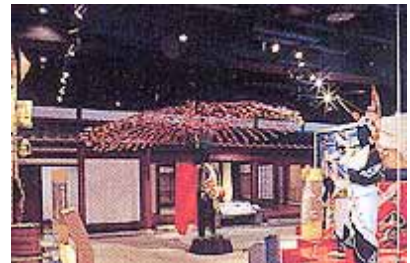
時津町民俗資料館