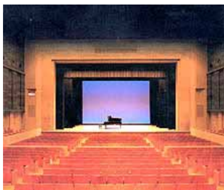
波佐見町総合文化会館 文化ホール