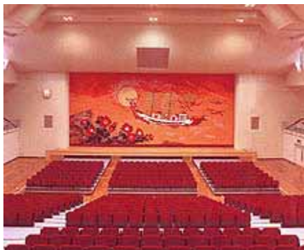
石油備蓄記念会館 アリーナ