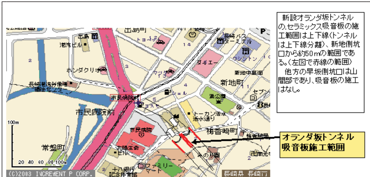
トンネル坑口に設置した吸音板 施工位置