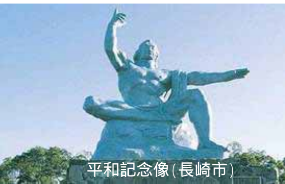
平和記念像(長崎市)