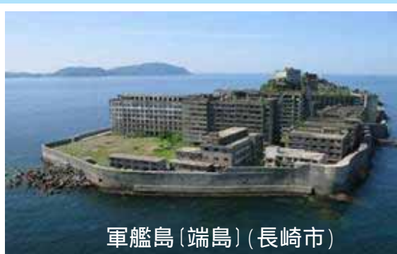
軍艦島(端島)(長崎市)