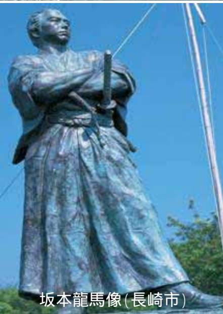
坂本龍馬像(長崎市)