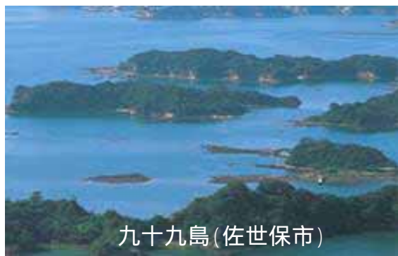
九十九島(佐世保市)