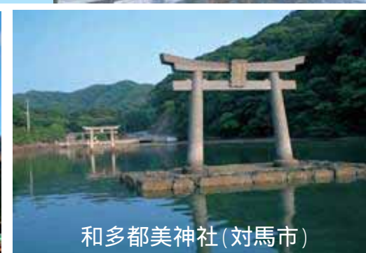
和多都美神社(対馬市)