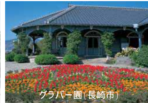
グラバー園(長崎市)