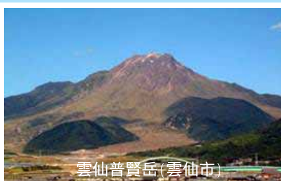
雲仙普賢岳(雲仙市)