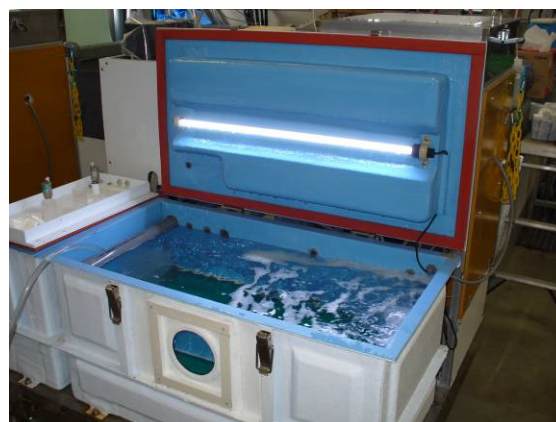
図 1 改造した活魚輸送装置 (試作機) の外観