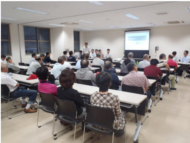
南部市民センター (平成27年6月27日)