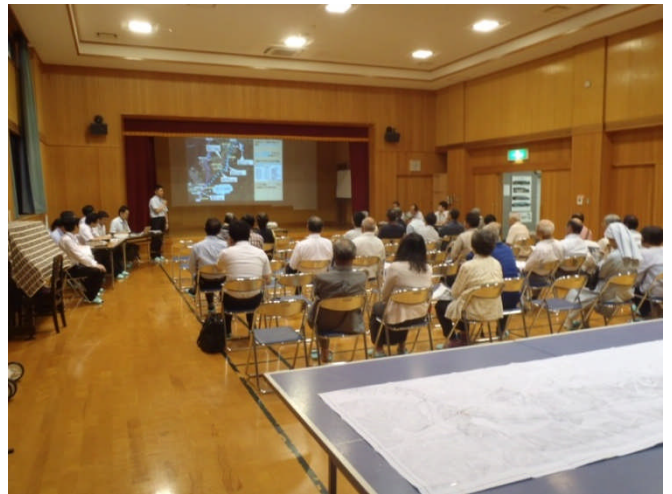
ダイヤモンド・小ヶ倉ふれあいセンター (平成27年6月30日)