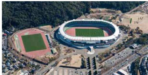
県立総合運動公園

諫早市宇都町 駐車場13,000㎡（普通車323台、大型車41台） 国体のメイン会場となった公園の駐車場増設工事