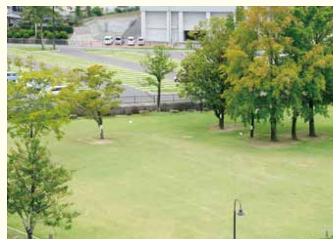
芝生広場の耐圧性を高め、駐車場としても対応できるようにした。（意見②）