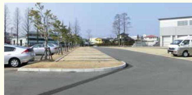
再利用可能な樹木は駐車場の境界等に移植した。（意見③）