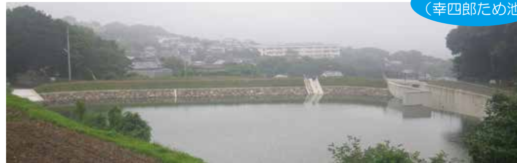
整備後 （幸四郎ため池）