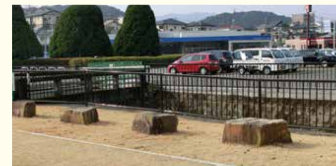
現地発生の石材をベンチとして再利用した。