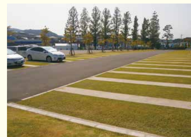
乗用車専用の駐車スペースを緑化舗装にすることで、緑に囲まれた駐車場としての整備を行った。（意見①）