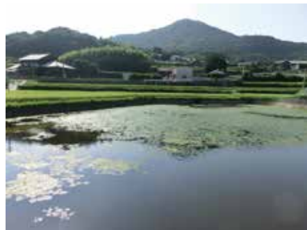
農村風景の中のため池

平戸市生月町里免 幸四郎ため池：堤長64.0m、堤高4.27m、洪水吐32.4m 金石田ため池：堤長32.5m、堤高3.20m、洪水吐11.9m 農村地帯におけるため池の改修工事（堤体・洪水吐の補修）