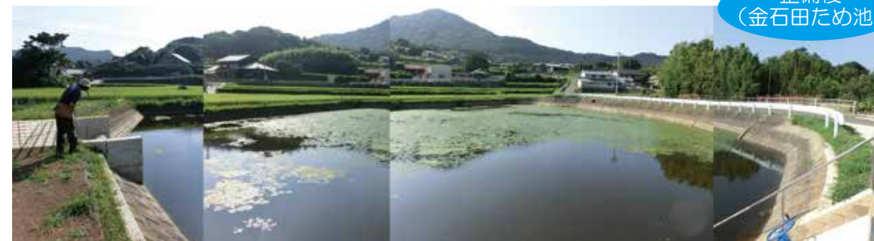
整備後 （金石田ため池）