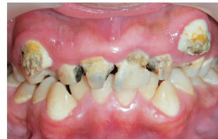
むし ば 歯の状態