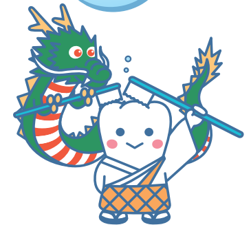
「よ坊 ぼう さんと は 歯 じゃ っぴい龍」