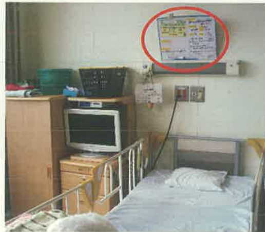
写真4 ベッドサイドのホワイトボード

限でリアルタイムに共有できる情報なのか（看護師の負担にも配慮）検討いただくこと、職員が共有できるための講習を行い、記載方法・読み方・共有言語の理解を深めることが大切だと思います。当院のツールも未だ改良すべき点が多いものではありませんが、今後、同様な取り組みを希望される施設様にとって、少しでもお役に立てれば幸いです。ご興味があり、見学等を希望される場合は対応させていただきますのでご遠慮なく当院看護部までお問い合わせ下さい。