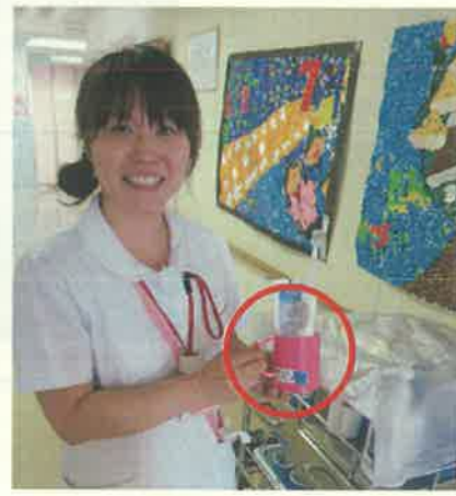
写真5 ラベルを貼ったコップ