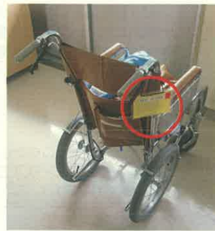
写真6 活動度ラベルを貼った車椅子