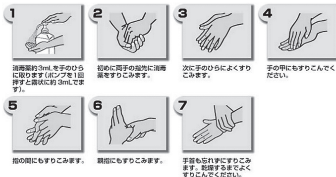
速乾性手指消毒薬による手指衛生の手順 (ヨシダ製薬のウェブサイトから引用)