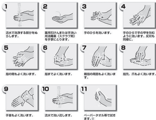
石けんと流水を用いた手指衛生の手順

手指衛生には主に2種類の方法がある。それは、石けんと流水による手洗いと、アルコールを基剤とする速乾性手指消毒薬