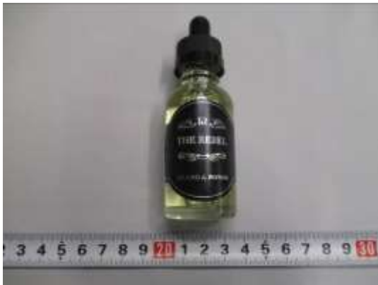
THE REBEL LEGEND by ROYKIN （黄色の液体）