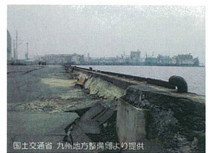
福岡県西方沖地震による岸壁の被災状況