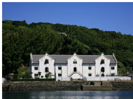
江戸時代初期の貿易拠点 「平戸オランダ商館」の復元