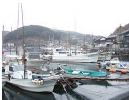
大島港的山地区 係留施設(浮体式)を新設し利便性向上