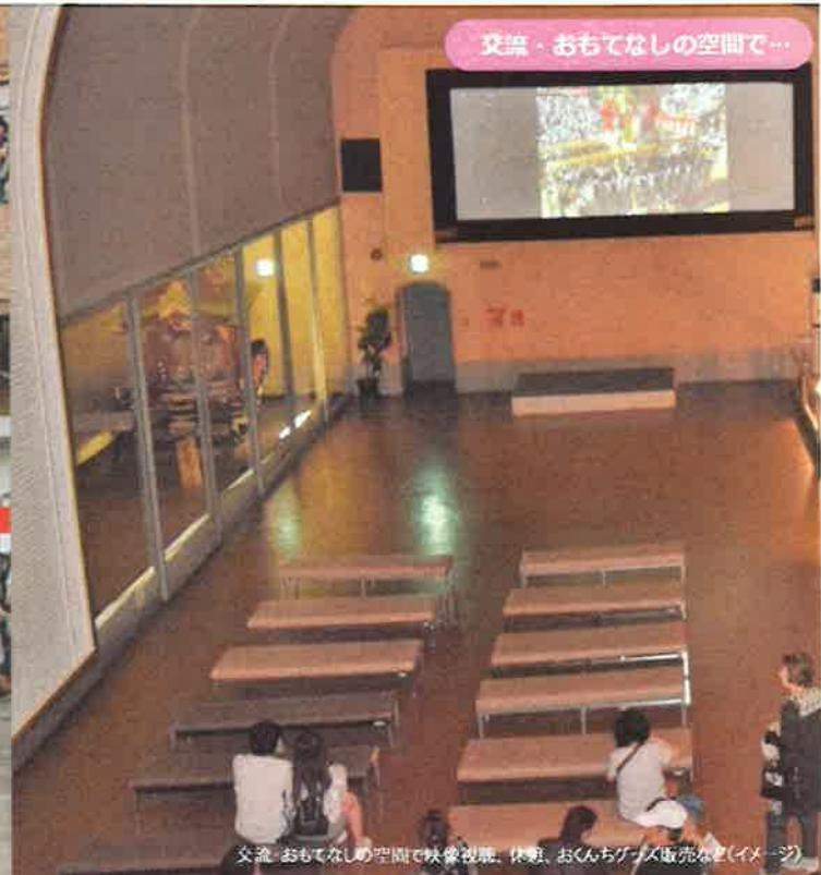
交流・おもてなしの空間で映像観覧、休憩、おくんちグッズ販売など(イメージ)