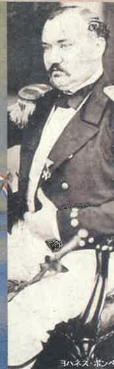
ヨハネス・ボンベ