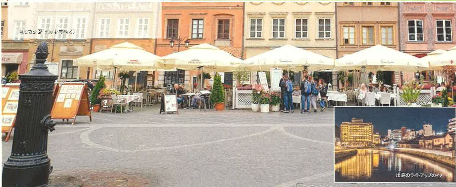
南池袋公園(東京都豊島区)

テーブル越しに、広場のイベントや出島のライトアップ、港の花火を楽しみながら、長崎を味わう。