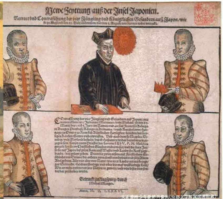
Nouve Septentrion auf der Insel Japonien. Verrückend Concratung der vier Hängling und Königlichem Gefandten auß Japan wie sie zu Nagasaki den 22. Febr. ankommen und den 6. März zu den Kaiserlichen Residenz.

Concratung der vier Hängling und Gefandten auß Japan wie sie zu Nagasaki den 22. Febr. ankommen und den 6. März zu den Kaiserlichen Residenz ... Anno, M. DC. LXXXVI.