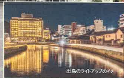
出島のライトアップのイメ