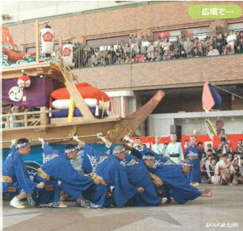
おくんち庭先回り