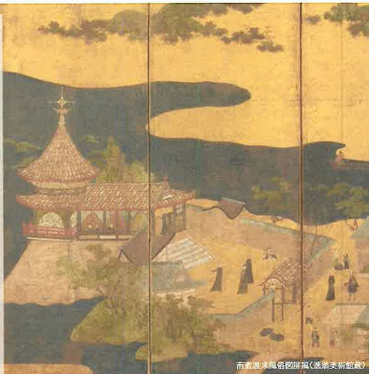
南蛮船来風俗図屏風(逸翁美術館蔵)

(例示) 県庁舎跡地の歴史(森崎神社/岬の教会/長崎奉行所西役所/海軍伝習所/医学伝習所/語学伝習所) 関連する人物(天正遣欧少年使節/勝海舟/坂本龍馬/ガイド・フルベッキ/ボンベ/本木昌造/平野富二) その他コンテンツ(医学/キリスト教/活版印刷/造船)