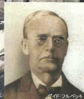
ガイド・フルベッキ