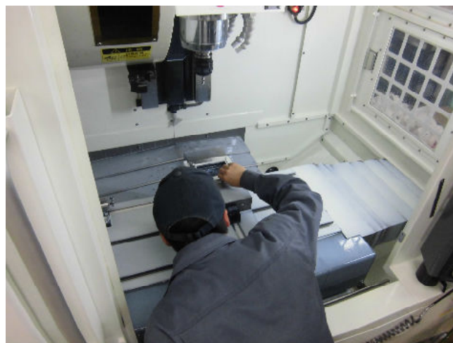
マシニングセンタ実習