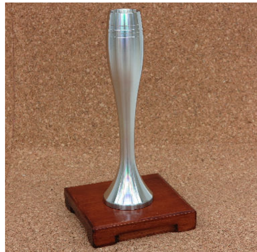
技能のひろば即売製品 (一輪差し)