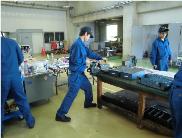
やすり掛け実習 (手作業で精度の高い仕上げを行います)