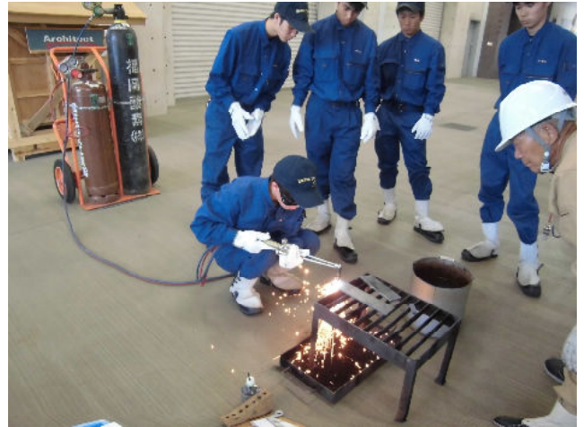
ガス溶接技能講習 (ガス溶接の資格講習です)