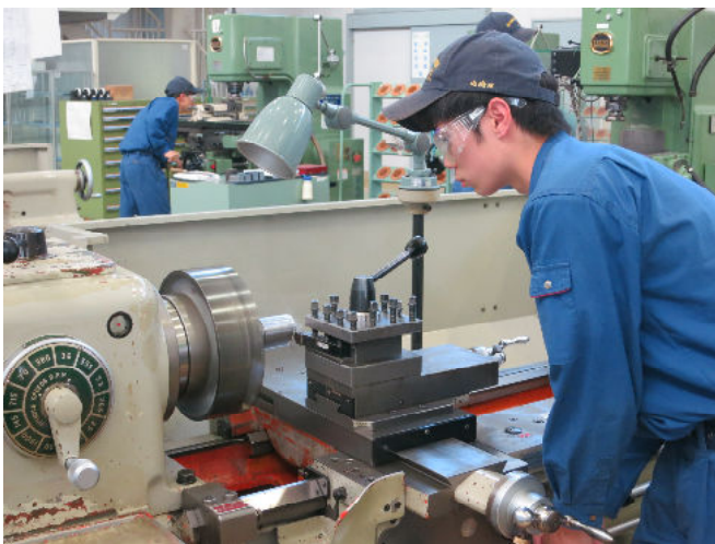
旋盤実習 (軸状の製品を加工します)