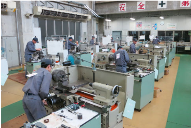
技能検定受験風景 (2年時に普通旋盤作業の2級を受験します)