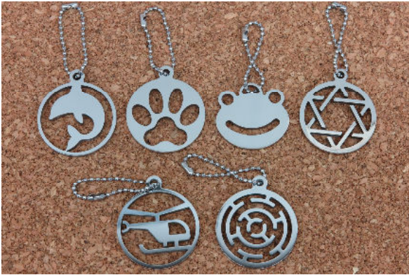
技能のひろば即売製品 (キーホルダー)