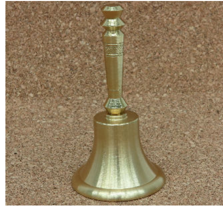
技能のひろば即売製品 (ハンドベル)