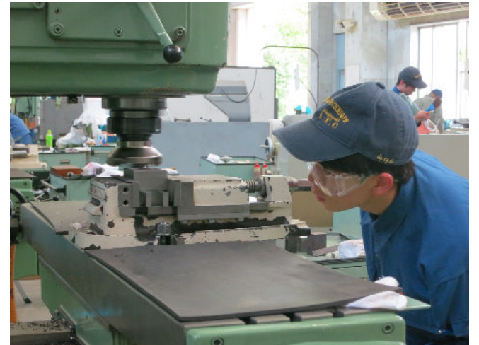
フライス盤実習 （平面を削っているところです）