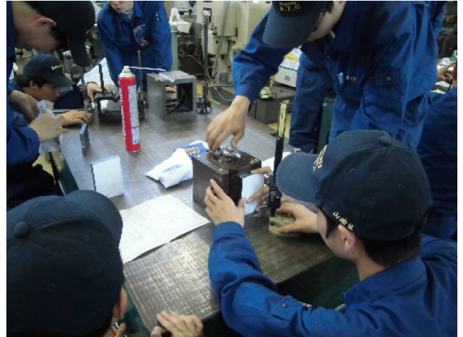
けがき実習 (加工に必要な線を引く作業です)