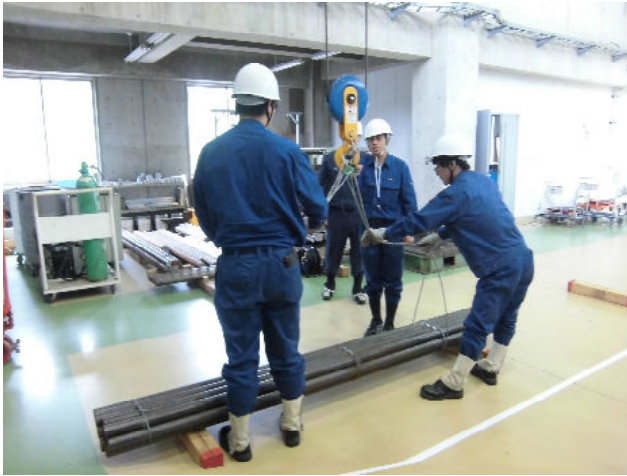
玉掛け技能講習 (クレーンで荷物を吊るための資格講習です)