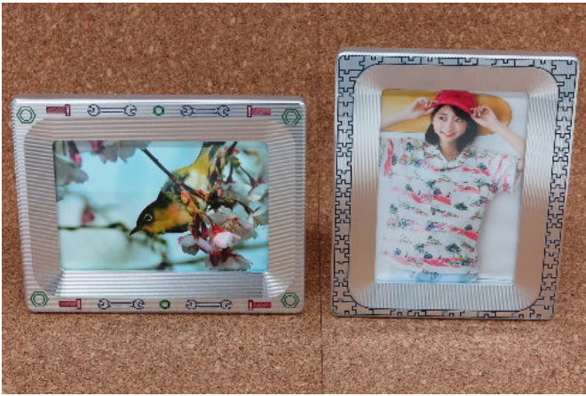
技能のひろば即売製品 (写真立て)