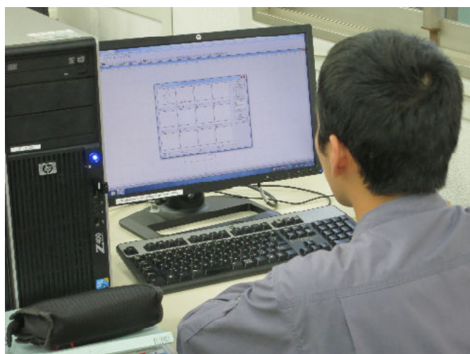
CAD/CAM実習 (コンピュータを用いた設計)