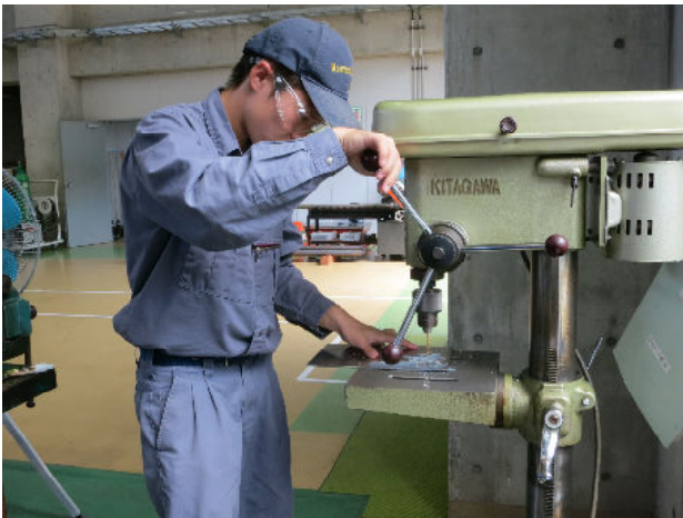
ボール盤実習 (ドリルによる穴あけ)