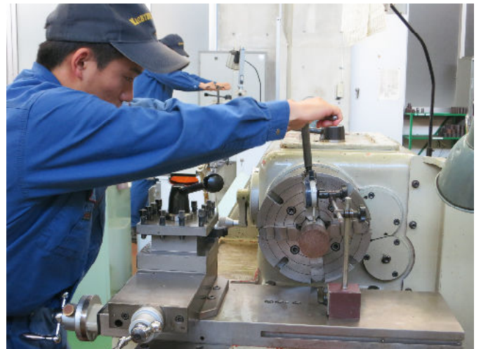
旋盤実習(心出し) (材料を回転中心に取り付ける作業)