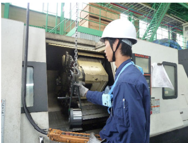
インターンシップ (実際の工場です3日程度の実習を行います)