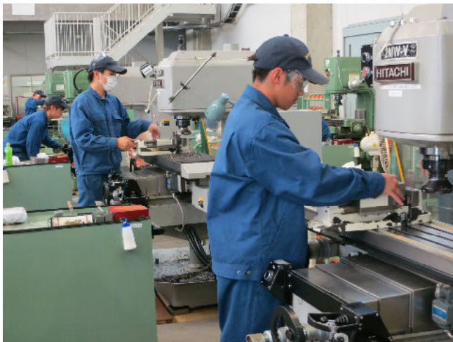
フライス盤実習 （回転する刃物で材料を削ります）