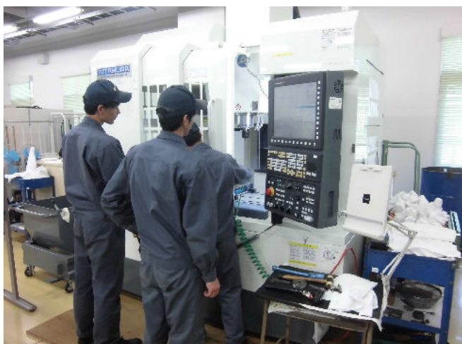
マシニングセンタ実習