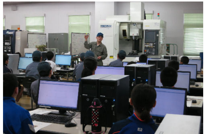
中学生のものづくり体験教室 (中学生の皆さんに、もの作りを体験していただきます)