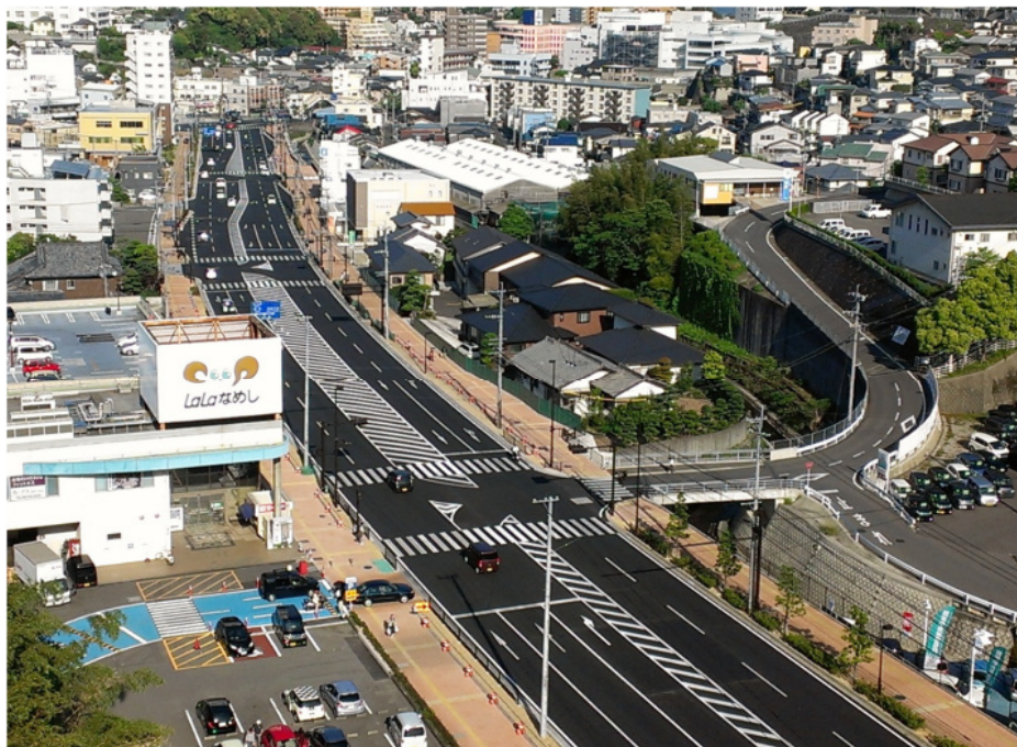
完成した横道工区

このうち、『横道工区』(580m)については、平成25年12月7日に4車線での供用を開始しました。現在、『大神宮工区』(850m)についての整備を進めています。