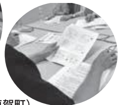
迎推進員(小値賀町)