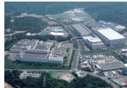
敷地面積は東京ドーム約6個分。1987年創立の「ソニー長崎」が前身

当社は諫早中核工業団地内にあり、「 CMOSイメージセンサー 」という製品を作っています。これは、レンズで集めた光(映像)を電気信号に変える半導体で、主にスマートフォンのカメラに搭載されています。おかげさまで私たちの製品は世界トップシェアを占めています。諫早市は交通が便利で、半導体の製造に不可欠な水の供給にも恵まれていることなどが大きな利点の一つです。