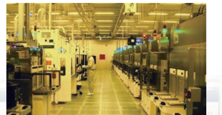
イメージセンサーを製造するクリーンルーム

年に2回、新卒者を対象にインターンシップも受け入れていますので、関心のある方はぜひご参加いただきたいと思います。