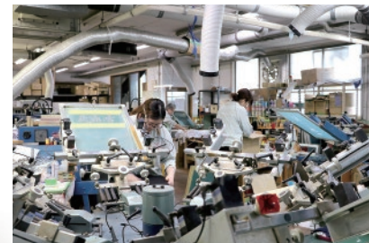
プリントのための大型機械を備える工場

父が1978年に地元のスポーツ店からユニホーム用の刺しゅう加工を請け負ったのが事業の始まりです。その後、スポーツが盛んになったことや学校の制服・体操服のネーム刺しゅうを毎年県内外から受注することで生産規模が拡大しました。刺しゅうやプリントなどの技術の蓄積があり、工場にはニーズに応じてさまざまなオリジナル製品が作れる設備が充実しています。