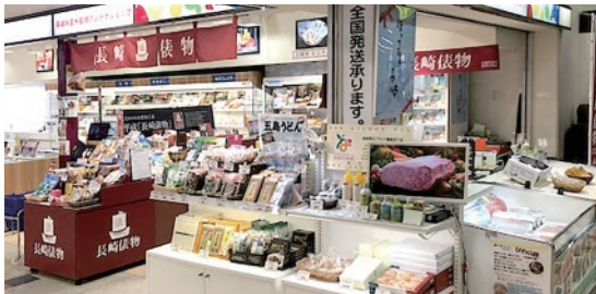
長崎県農水産物アンテナショップ(長崎空港内)

この歴史にちなんで、長崎で水揚げされた魚介類を使用した県産水産加工品の中から、厳格な認定基準をクリアしたものを現代の「長崎俵物」として認定しています。