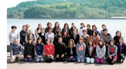
子育てや介護をしながら働ける職場として地域に必要とされている