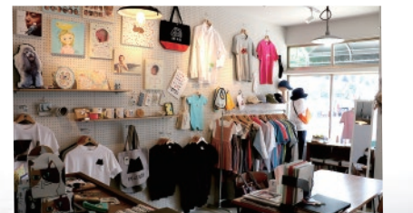
「Manto」は人通りの多い佐世保市万津町 よろずちょう にあり、多くの人々が訪れている

3年前、女性や学生さんにも気軽に利用してほしいと思い、佐世保市に個人客向けの支店「Manto」をオープンしました。ここではTシャツやバッグなどのサンプルやオリジナル製品を展示し、ニーズの把握やオーダーメイドの提案などを行っています。技術と生産能力には自信がありますので、それを生かした新事業の展開や販路拡大が今後の目標です。若い世代を含め新しい人材を採用し、事業企画や広報・営業活動を強化していきます。