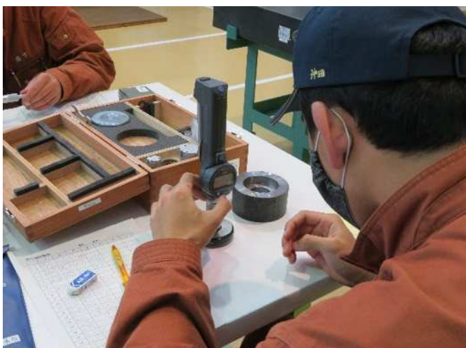
精密測定器を使って、0.01 mm単位の測定ができるようになります。