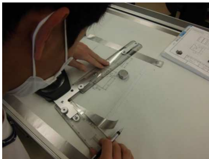
製図機を使って、機械部品の図面の作成を学びます。