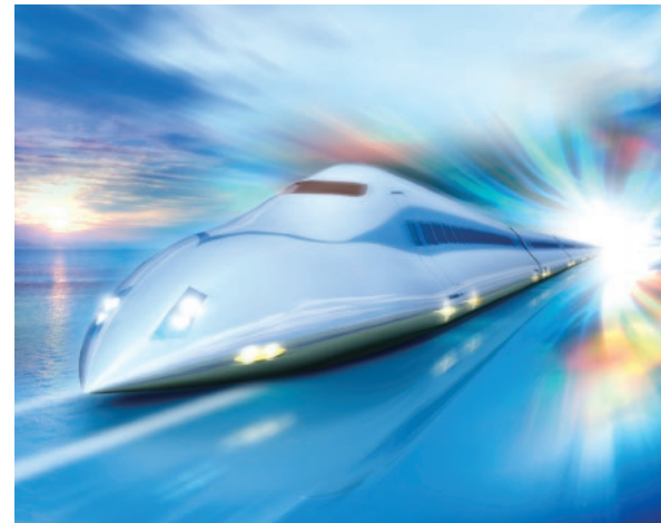
2022年度開業予定の新幹線(イメージ)

九州新幹線西九州ルートの開業を見据えたまちづくりやIR(特定複合観光施設)の誘致。日本を代表する情報システム関連企業の進出や、航空機関連・海洋エネルギー関連など新しい産業の創出。今、長崎県のまちや産業構造は大きく変わろうとしています。100年に1度ともいえる変革期を迎える本県には、若い力が必要です。県は、生まれ変わりゆく長崎県で働き、暮らすという選択を全力で応援します。