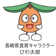
長崎県食育キャラクター びわ太郎

家族や友人と一緒に食べる楽しさをテーマにした標語・写真・絵画を募集します。入賞作品は、ウェブサイトなどで紹介する予定です。