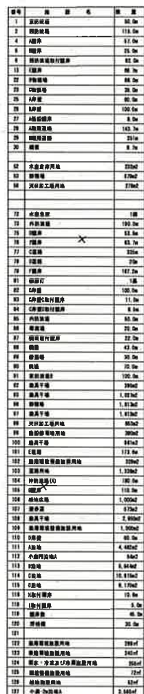
小鹿漁港台帳平面圖