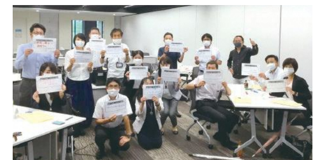
9月16日に開催したセミナー参加者によるイクボス宣言

※県内の経済界や企業・報道機関、大学、行政などで構成し、企業などにおける女性の活躍の場を広げ、地域経済の活性化を図ることを目的とした官民一体の組織です