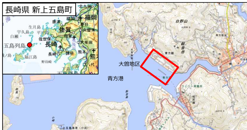
国土地理院地図(電子国土Web) ( http://maps.gsi.go.jp ) をもとに国土交通省作成

令和2年8月3日に青方港が「釣り文化振興モデル港」に指定され、長崎県内および全国の離島としては、初めての指定港となります。