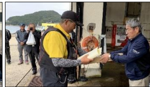
釣り大会 開催状況