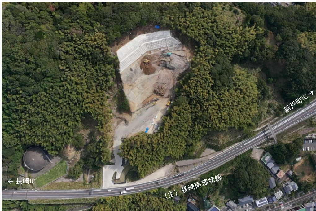
・令和2年10月末の状況