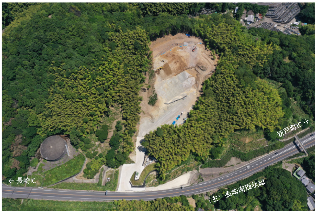
・令和2年6月末の状況