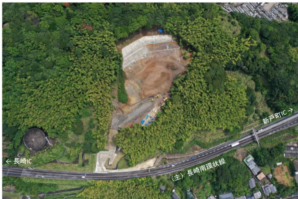
・令和2年8月末の状況