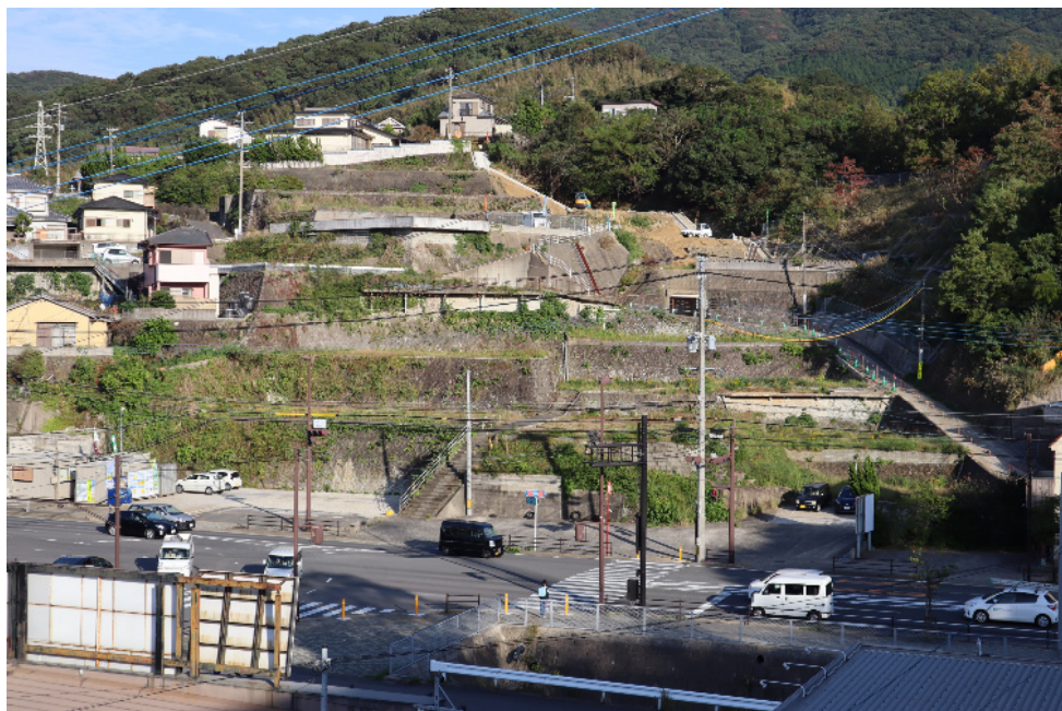
・令和2年10月27日の状況