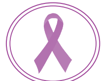
パープルリボン 女性に対する暴力の根絶の シンボルマーク

夫・パートナーからの暴力、性犯罪、売買春、セクシュアル・ハラスメント、ストーカー行為といった女性に対する暴力をなくす運動が全国で行われます。長崎県男女共同参画推進センターきらりあでも、県内21市町と連携して、パープルリボンプロジェクト・パープルライトを実施します。