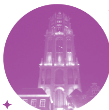
ハウステンボス ドムートルン