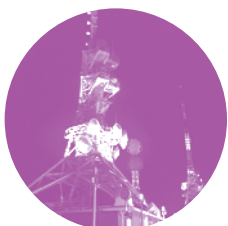
稲佐山山頂電波塔