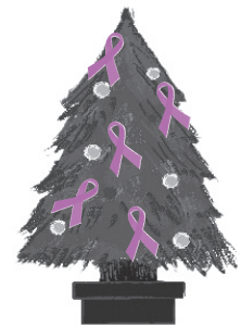
ツリーに パープルリボンをつける プロジェクト