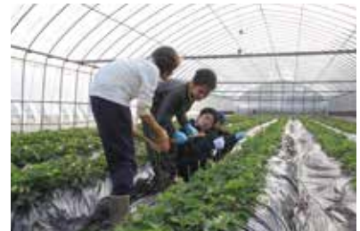
① 딸기 손질 작업