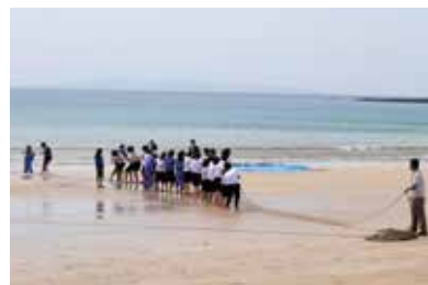
② 후릿그룹 고기잡이

농사 체험, 어업 체험 등 다양한 장소에서 체험합니다. 클래스 단위나 그룹 단위로 체험이 가능하며, 원하는 체험 내용을 선택하실 수 있습니다.