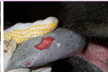
舌のびらん(黒毛和種)