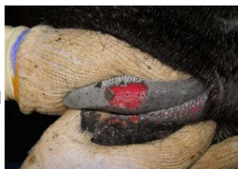
舌のびらん(黒毛和種)