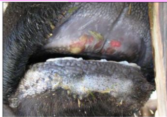
歯床部粘膜のびらん(黒毛和種)