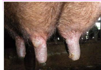
乳頭の水疱(黒毛和種)