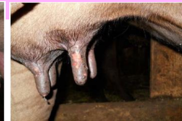
乳頭のびらん、痂皮(黒毛和種)