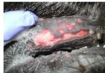
歯床部粘膜のびらん(黒毛和種)