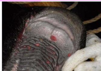
口蓋のびらん(黒毛和種)