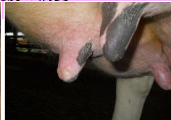
乳頭の水疱(ホルスタイン種)