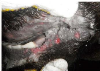
口唇部のびらん(黒毛和種)