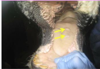
舌の水疱(初期)(ホルスタイン種)