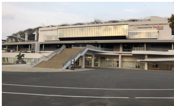
↑トランスコスモスタジアム （長崎県立総合運動公園陸上競技場）