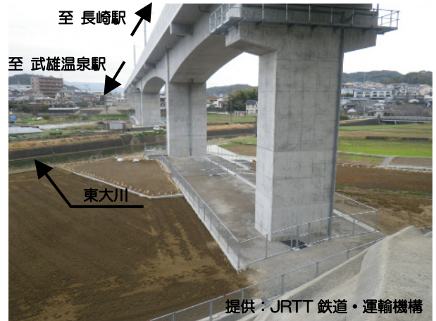
完成した東大川橋りょう（平山町）