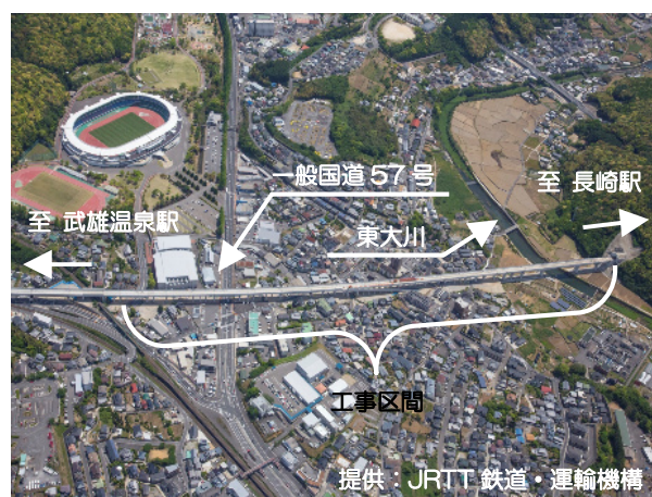
上空から工事区間全体を望む