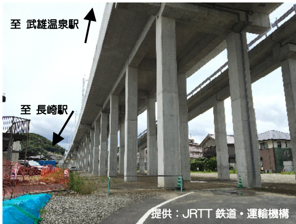
完成した第5平山高架橋（小船越町）