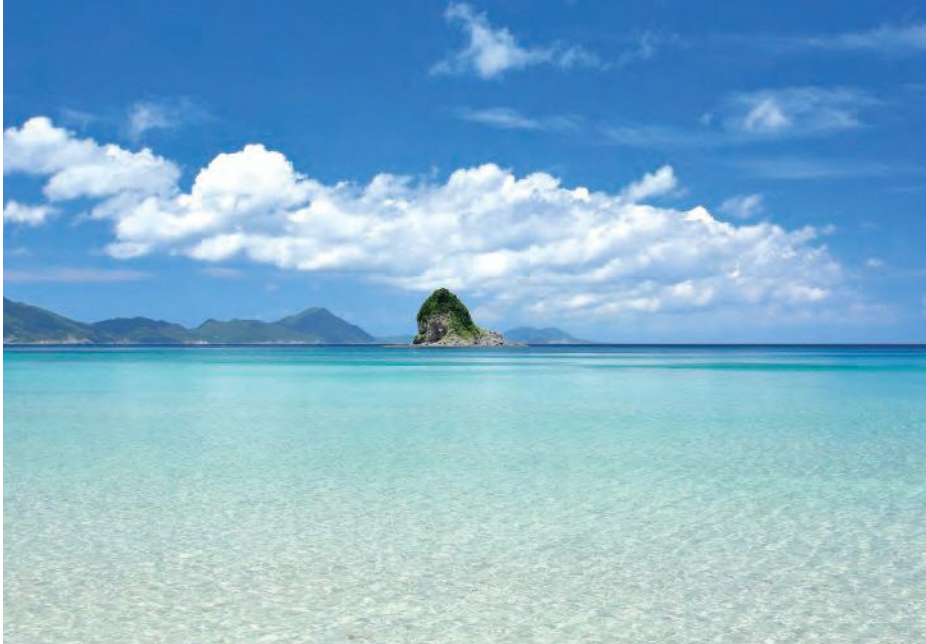
地元の人しか知らない絶景ビーチ「ハマナ」。青と白のコントラストが美しいビーチがどこまでも広がります