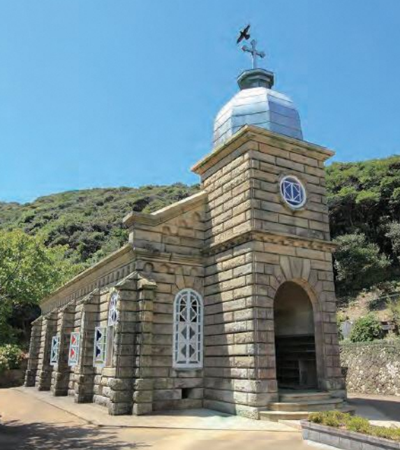
世界文化遺産の構成資産「頭ヶ島の集落」にある頭ヶ島天主堂