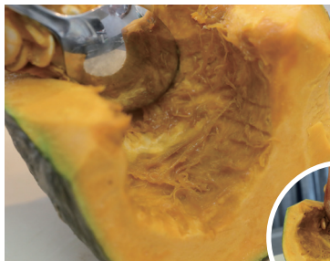
ワタは少し残るくらいがポイントです！

皮がかたく切りにくい場合は、1/4個の場合、電子レンジ600Wで1分～1分半加熱してから切るとよい。(まるごとの場合は3～4分)