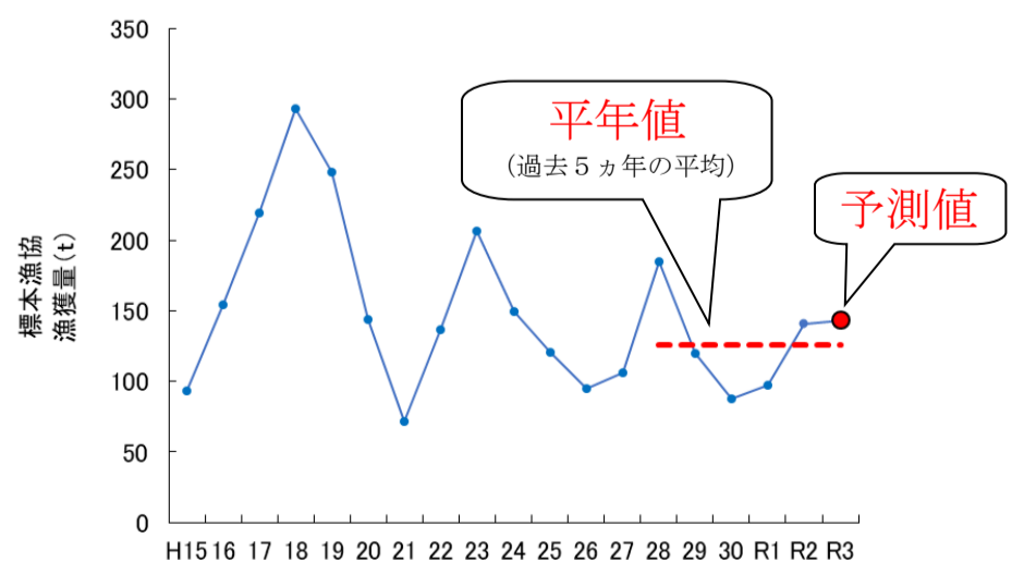
図2 本県標本漁協におけるトビウオ類（小トビ）漁獲量