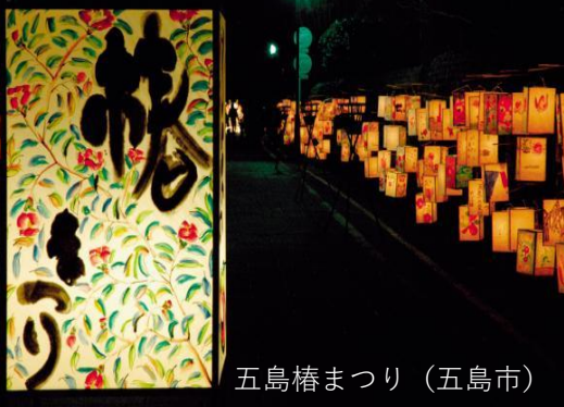
五島椿まつり（五島市）