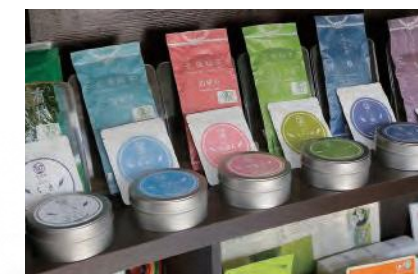
海外向けも意識して、パッケージを一新

父は長年、佐々町の茶業部会の会長を務めており、私も指導農業者、佐々町農業委員、県北グリ茶研究会の会長などを務めています。佐々のお茶をまずは地元の人に親しんでもらいたいという思いから、毎年秋に福祉施設や学校、保育園などにうがい用のお茶を寄付しているほか、県北グリ茶研究会では、高校生のマナー講習の一環としてお茶の入れ方教室などを開催しています。お茶のおいしさとともに、日本独特のお茶の文化も伝えていけるよう頑張っています。