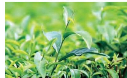
有機栽培で元気に育つ茶葉