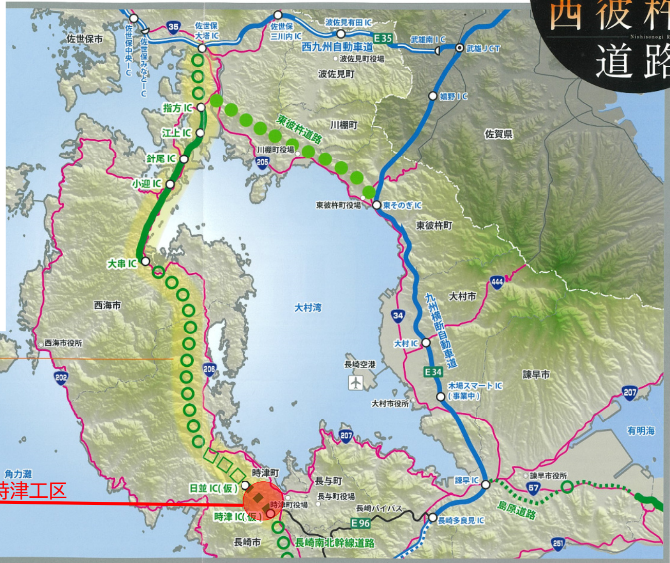
西彼杵道路計画路線図