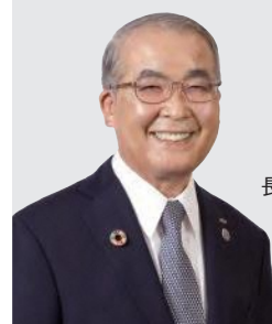
長崎県知事 中村法道

【電話番号】総合案内: 095-843-6642 FAX: 095-847-1700 【利用時間】10時~18時30分 【メールアドレス】jinzai-center@sougoshugyo.jp 【所在地】長崎市川口町13-1 長崎西洋館3階 【休館日】土・日曜、祝日、年末年始、長崎西洋館の休館日 ※県北地区にお住まいの方は、佐世保市内の窓口(県北振興局1階)もご利用いただけます【電話番号】0956-24-7431