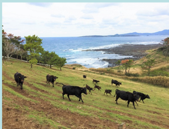
傾斜地を活用した放牧