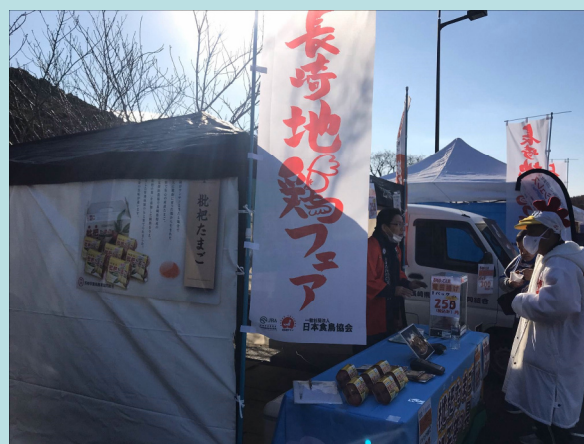
長崎地鶏フェアの開催による 消費拡大の取組