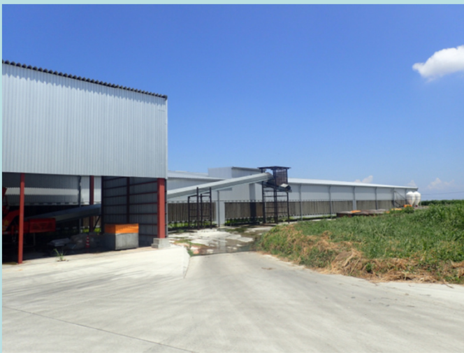
畜産クラスター構築事業による搾乳牛舎の整備