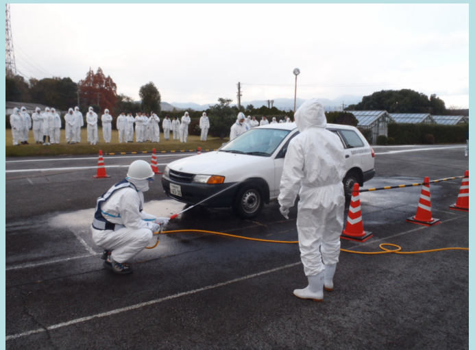
車両消毒作業の演習