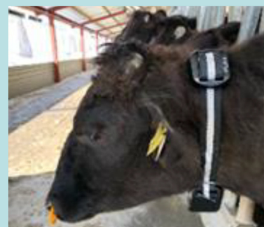
生体モニタリングシステム