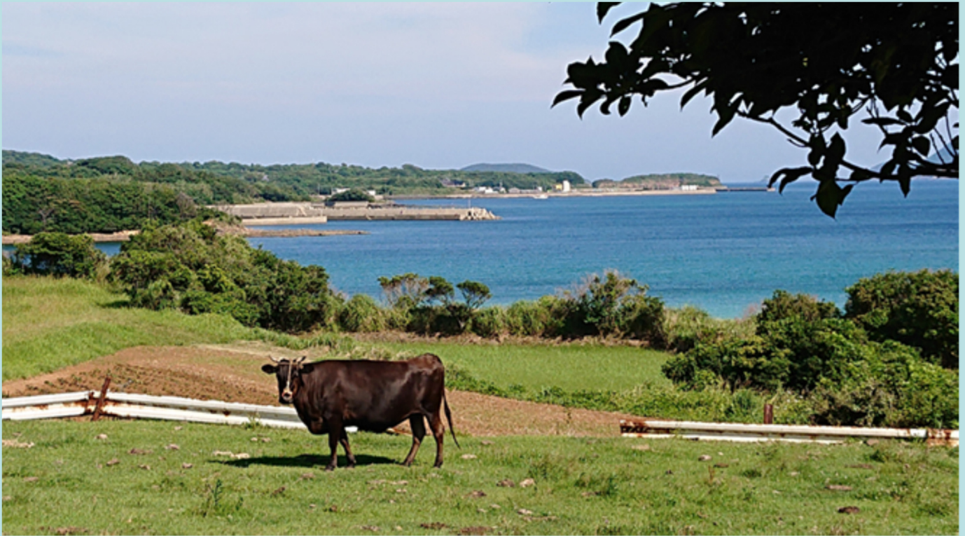
撮影場所:佐世保市宇久町

このように、豊かな自然と畜産に長い歴史を持つ長崎県は、県内外へ、良質で安全な畜産物の供給基地となっています。