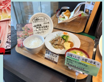
県庁レストランでの県産豚肉メニューのPR提供