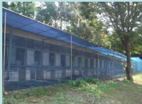
野生動物侵入防止のためのネットの設置