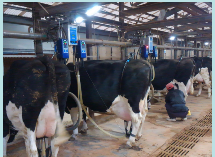
搾乳ユニット自動搬送パイプライン