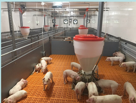
畜産クラスター構築事業を活用した豚舎整備