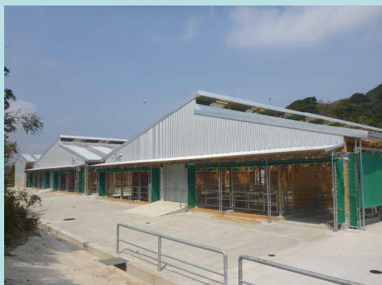
畜産クラスター構築事業による牛舎整備