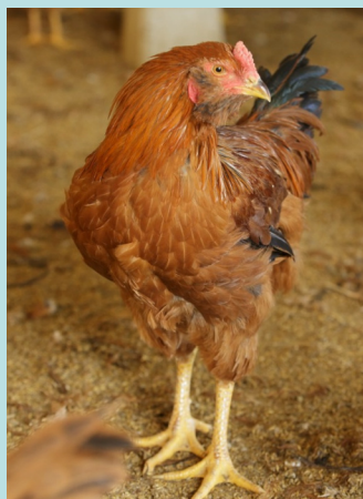
肉用専用種として流通している 「長崎対馬地どり」