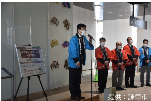
平田副知事あいさつ

本イベントは、普段は決して入ることのできない、線路の敷地内を歩く体験をしていただくもので、倍率7倍を超える狭き門をくぐり抜けた約千人の参加者が、秋晴れのもと、諫早駅から長崎方向にある諫早トンネル入口までの片道約400mの線路内を、途中機構職員から工事の説明を聞いたり、写真を撮ったりしながら、ウォーキングを行なった。