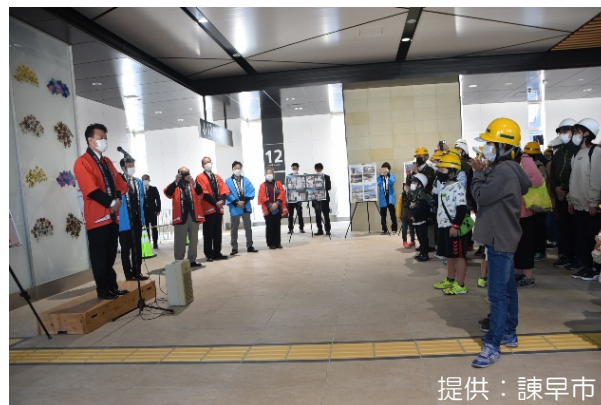
大久保市長あいさつ