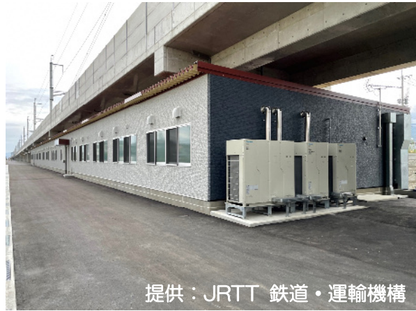
大村現業事務所全景 (大村市植松 3 丁目)