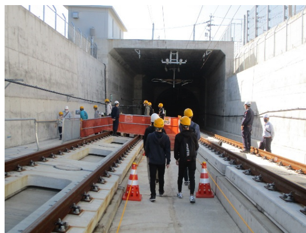
コースの折り返し地点となる諫早トンネル付近