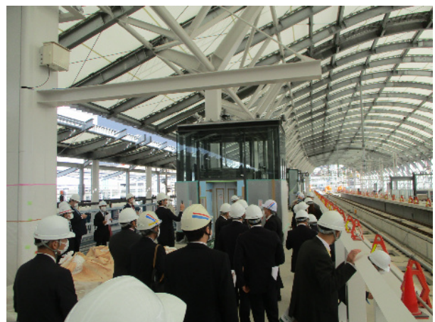
ホーム上での調査の様子