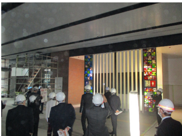
コンコースでの調査の様子

令和3年11月11日に、長崎県議会の総務委員会と観光生活建設委員会の皆様による、長崎駅の整備状況についての現地調査が行われた。