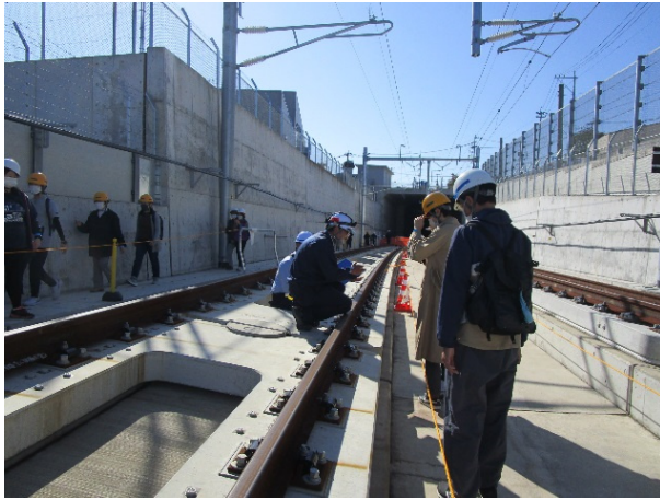
鉄道・運輸機構の職員から 線路の説明を受けている様子