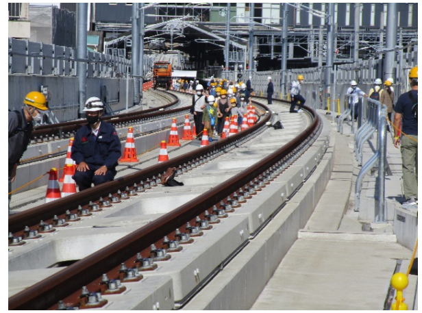
武雄温泉駅・長崎駅間で 一番カーブがきつい区間

また、諫早駅の自由通路においては、終盤を迎えている新幹線工事の様子や変わり行く街並みを知っていただくため、ピフォーアフターの風景や施工状況などの写真をパネルにして掲示し、通行される皆様へご覧いただきました。