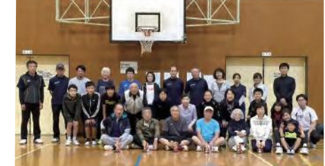
とぎつジョイクラブの皆さん

2015年に設立した総合型地域スポーツクラブ「とぎつジョイクラブ」は、子どもと大人が一緒になってスポーツを楽しむことができる地域団体です。クラブの会員は小学生から70代まで53名、そのうち約20名が小中学生で、週に1〜2回、町内の体育館やグラウンドで活動しています。特徴は、パドルテニスを中心に、陸上競技、健康運動、軟式テニスなど、多種目のスポーツを楽しめることです。年に数回、パラライニングディスクやボッチャなど、パラ