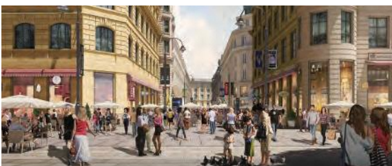
ハウステンボスの景観と調和した街並みのイメージ

東洋・西洋の良いところを調和し、日本の先端技術を融合した県民が誇らしさを感じることできるIR施設を目指します。