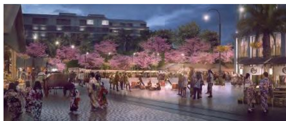
整備される桜並木のイメージ